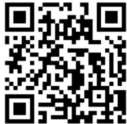
Soinin kunnan Instagram